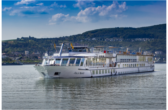
MS Dutch Melody

Auf dem Prelude Deck steht Ihnen eine Sauna zur Verfügung. Das Schiff bietet zudem ein viertes Deck, das Sonnendeck, welches mit Liegestühlen ausgestattet ist, in denen Sie die vorbeiziehenden Landschaften genießen können. Alle Decks können über einen Lift bzw. Treppenlift (Sonnendeck) erreicht werden. Das Schiff verfügt über 70 Außenkabinen, die sich auf 3 Decks (Serenade Deck 15 Kabinen, Sonata- bzw. Cantata Deck 41, Prelude Deck 14 Kabinen) verteilen. Die Kabinen verfügen alle über zwei Betten, die tagsüber zusammengeklappt werden können, um eine gemütliche Sitzgelegenheit zu schaffen. Sie sind ungefähr 14m 2 groß. Die Kabinen verfügen alle über DU/WC, Föhn, Safe, individuelle Klimaanlage, Telefon und Farbfernsehen. Die Kabinen auf dem Serenade Deck verfügen über bodenhohe Schiebetüren und einen kleinen Balkon. Auf dem Sonata Deck haben die Kabinen große Schiebefenster. Die Kabinen auf dem Cantata Deck bieten dem Gast große Fenster und die Kabinen auf dem Prelude Deck befinden sich auf Wasserspiegelhöhe und verfügen über kleinere Fenster. Bitte beachten Sie, dass sich die Fenster nur auf dem Serenade- und Sonata Deck öffnen lassen.